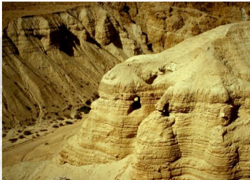
Die Qumran Höhlen